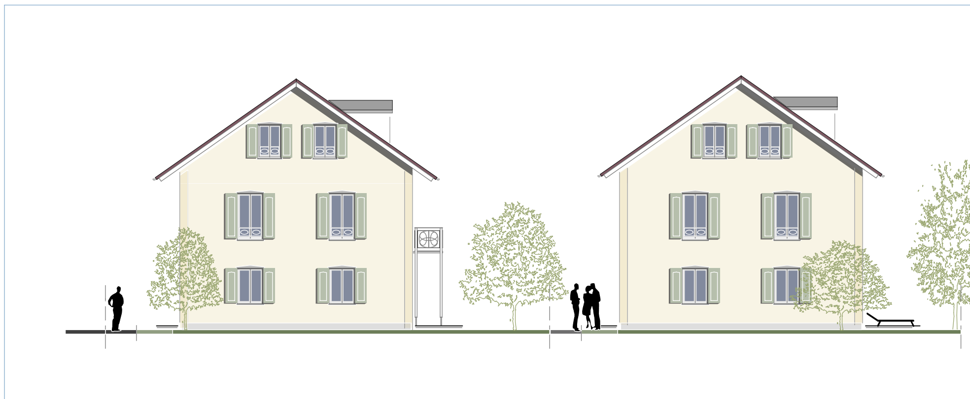
Reihenhaus (REH 1)