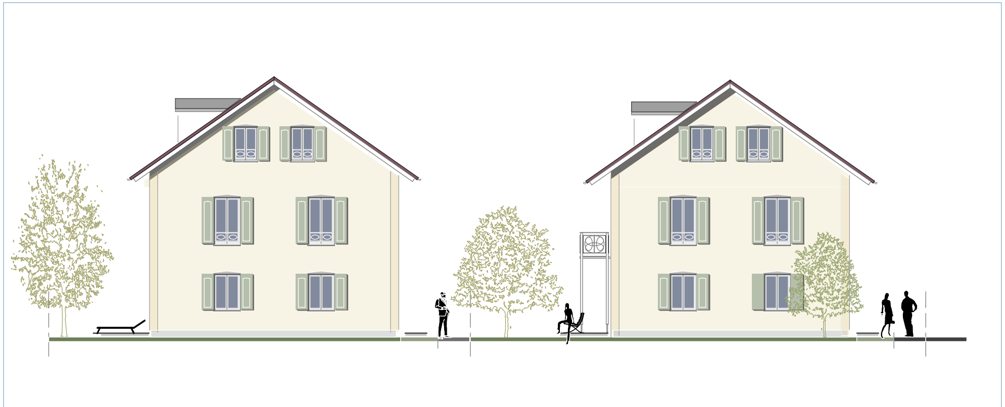
Doppelhaus (DHH 2)